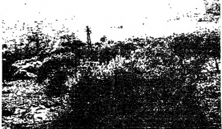
دخان يتصاعد من دبابات اسرائيلية تصف من الحزام

في اراضي الحزام الاسرائيلية - من لورين كورنا: دخن يتصاعد من دبابات اسرائيلية تصف من الحزام الاسرائيلية - من لورين كورنا.